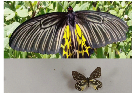
भारत की सबसे बड़ी तितली

(B) हाल ही में भारत की दूसरी सबसे बड़ी तितली प्रजाति, दक्षिणी बर्डविंग, मद्रुरै जिले में न्यू नाथम राजमार्ग पर चथिरापट्टी ओर कदावुर के बीच अमेरिकन कॉलेज के उपग्रह परिसर में पाई गई है। यह खोज इस क्षेत्र में तितली प्रजातियों की बदलती गतिविधियों पर प्रकाश डालती है। दक्षिण बर्डविंग को कभी भारत की सबसे बड़ी तितली माना जाता था, जिसके पंखों का फैलाव 190 मिमी था।